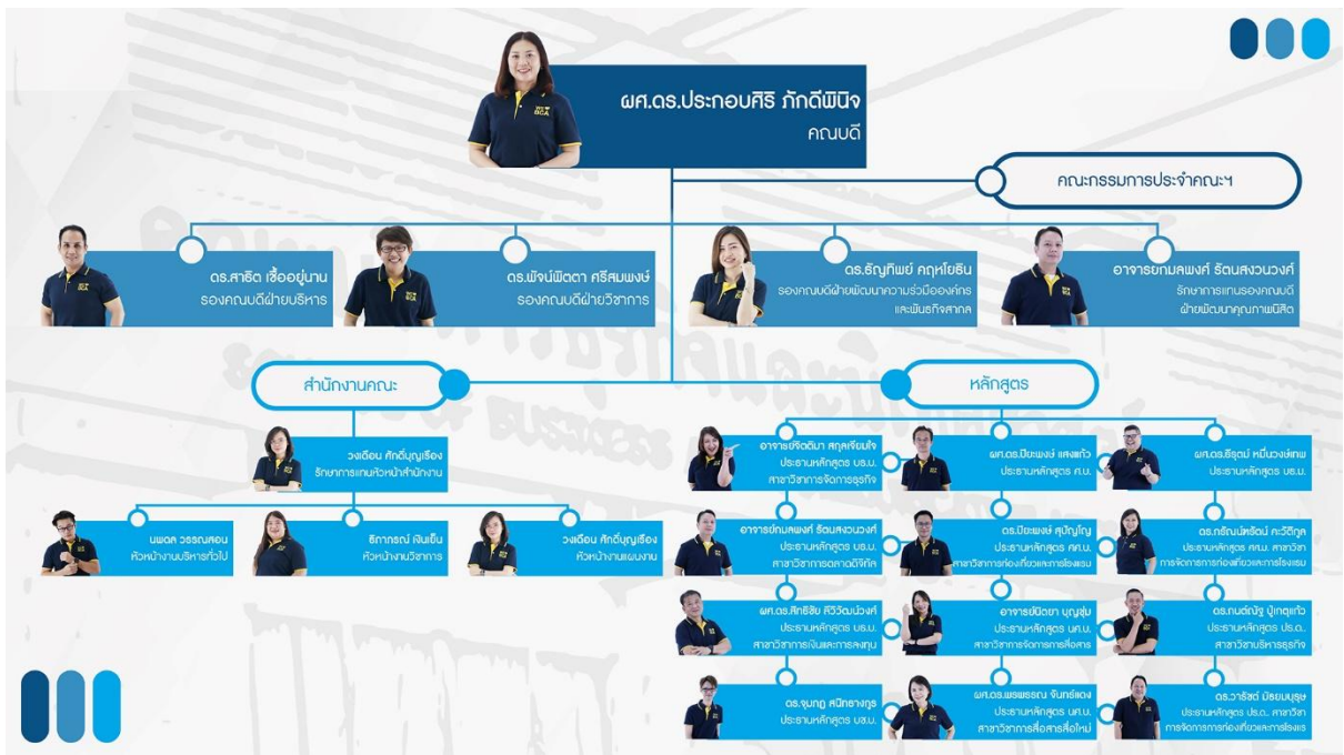
แผนภูมิที่ 2 โครงสร้างการบริหารงาน